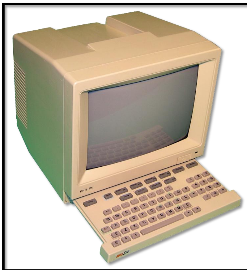
Immagine a scopo illustrativo

DESCRIZIONE: Descrizione storica - Una via di mezzo tra un televisore ed un computer: questo era il Video-Tel, un servizio fornito dalla SIP (l'odierna Telecom) che, tramite collegamento telefonico, permetteva di accedere a pagine d'informazioni (simili al TeleVideo televisivo) o interagire tramite messaggistica con altri utenti. L'apparecchio, dotato di monitor monocromatico da 9 pollici, tastiera e modem da 1200 baud, aveva un canone mensile di 7.000 lire, oltre al costo di collegamento che poteva variare in base al tempo o al tipo delle pagine visionate insomma, il servizio non era per niente economico, e non riscosse un grande successo.