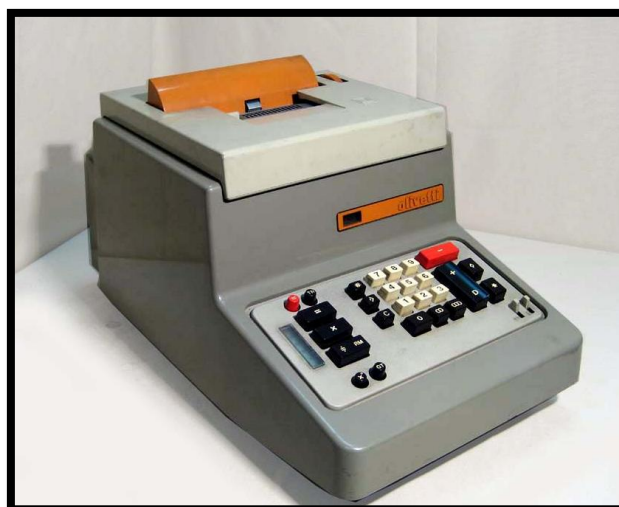
Immagine a scopo illustrativo