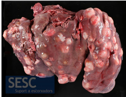
Parassitosi: Echinococcosi cistica