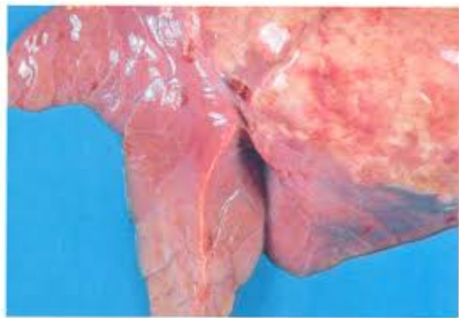
Polmonite apicale batterica

Nell'eventualità vengano riscontrate delle lesioni simili alle patologie riportate, l'allevatore deve eliminare o l'intero organo o la parte colpita e distruggerli tramite incenerimento. L'allevatore potrà sempre contattare Il Servizio Veterinario per eventuali dubbi o difficoltà operative.