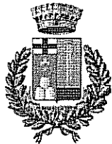
Comune di Padria