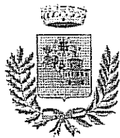
Comune di Villanova Monteleone