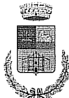
Comune di Mara