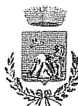
Comune di Monteleone Rocca Doria