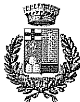
Comune di Padria