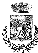
Comune di Monteleone Rocca Doria