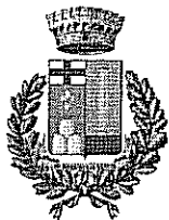
Comune di Padria