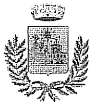
Comune di Villanova Montelone