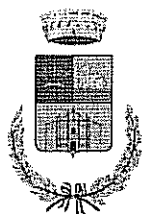
Comune di Mara