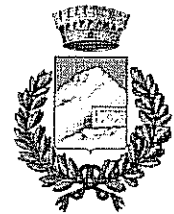
Comune di Romana