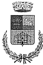
Comune di Mara