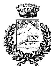
Comune di Romana