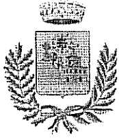
Comune di Villanova Montelone