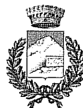
Comune di Romana

richiesta nell'ambito di procedimenti a carico delle ditte istanti. Il trattamento dei dati avverrà mediante strumenti, anche informatici, idonei a garantirne la sicurezza e la riservatezza. I diritti spettanti all'interessato sono quelli previsti dall'art. 7 del D.Lgs. 196/2003.