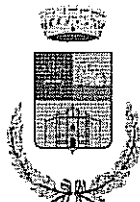
Comune di Mara