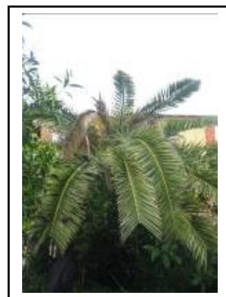
Fig. 4 Asimmetria della chioma e appiattimento

L'esito finale dell'infestazione di Rhynchophorus ferrugineus sui vegetali di palma è la morte della pianta, la cui chioma presenta tutte le foglie secche e ripiegate verso il basso, in una tipica forma ad ombrello.