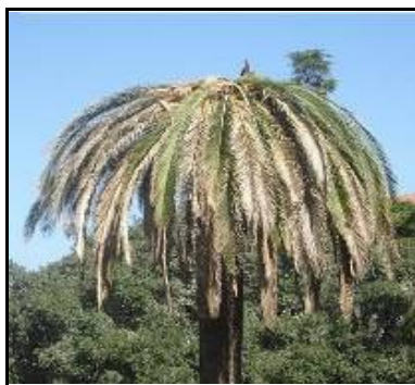
Fig. 5 Disseccamento generalizzato e appiattimento

L'esito finale dell'infestazione di Rhynchophorus ferrugineus sui vegetali di palma è la morte della pianta, la cui chioma presenta tutte le foglie secche e ripiegate verso il basso, in una tipica forma ad ombrello.