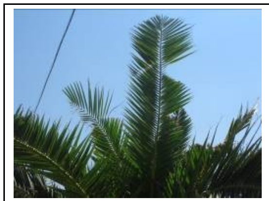
Fig. 3 Margini seghettati e rosure fogliari

Successivamente si ha un gradiente di danno sempre più intenso con la cima che si piega e la chioma che si appiattisce. La pianta, da un'osservazione a distanza, appare come appiattita.