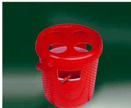
Fig. 1. Trappola a feromoni